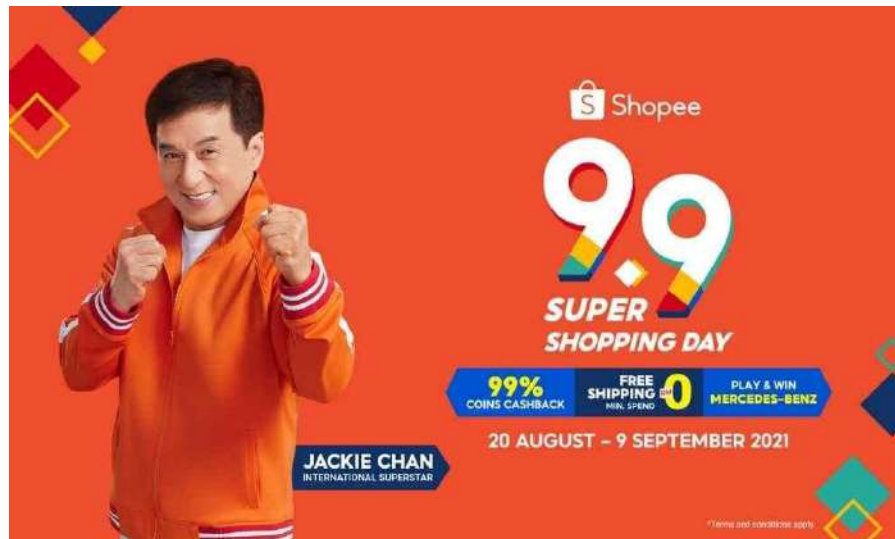
アクション俳優： ジャッキー・チェン