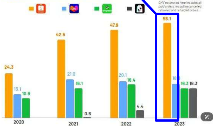
Key players' GMV performance in SEA (US$ B)